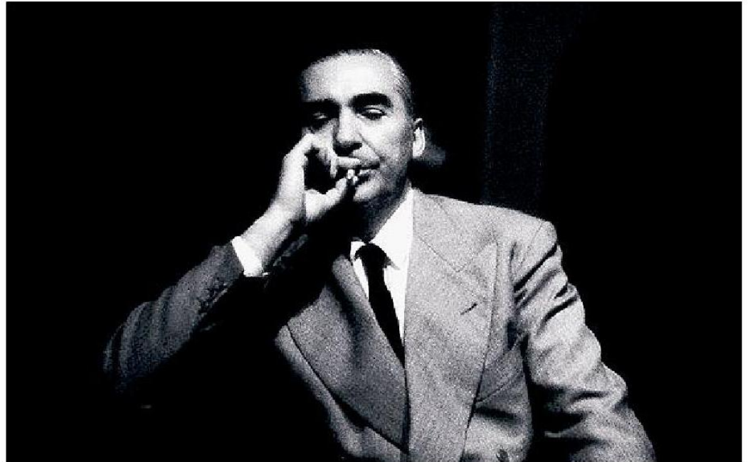
IL PROTAGONISTA Kurt Suckert (noto con lo pseudonimo di Curzio Malaparte) nacque a Prato, il 9 giugno 1898. Il giornalista e scrittore, tra il gennaio e l'aprile del 1939, attraversò l'Etiopia per il Corriere della Sera

MALAPARTE allora si dilegua: con l'aiuto di pochi amici fidati (un principe in disgrazia, un camorrista, un eccentrico artista e l'inseparabile cane Febo) condurrà in clandestinità una difficilissima inchiesta. Chi sta cercando di incastrarlo? Forse quell'ufficiale delle SS sempre in compagnia del suo sanguinario dobermann? E