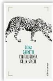
Elena Ghiretti, autrice di L'intelligenza della specie (Baldini&Castoldi, pagg. 256, € 16; e-book € 7,99).